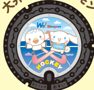
大井ふ頭シナカモン