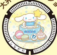
大井町イルミネーション