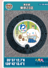
武蔵小山たけのこ