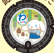
武蔵小山たけのこ