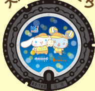
大井町ビーチユウ