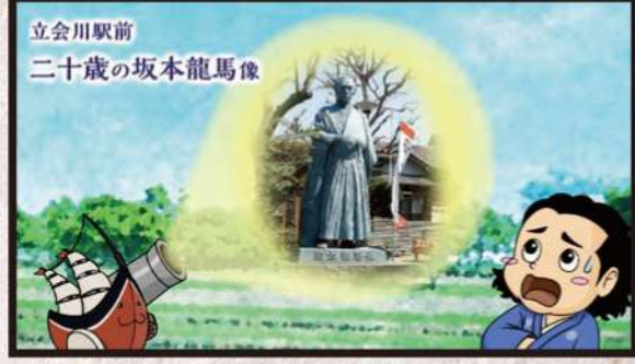
立会川駅前 二十歳の坂本龍馬像