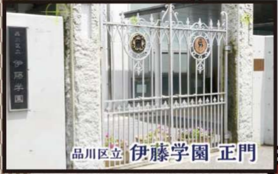
品川区立 伊藤学園 正門

9 伊藤博文の別邸は品川にありました。今では取り壊され、一部は山口県に移築されましたが、別邸の門は、伊藤学園の正門として残されています。学校の名前もそのまま伊藤博文の伊藤を使っています。