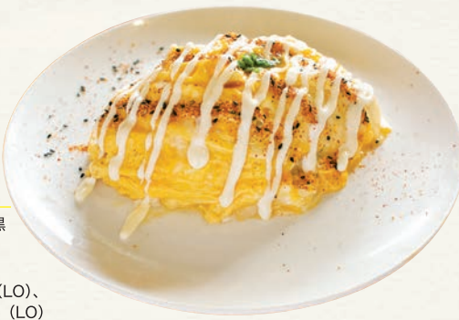
お正油オムライス (ランチ 1500 円、ディナー 1680 円)