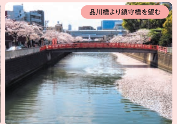
品川橋より鎮守橋を望む

四季折々の風情が楽しめる目黒から品川にかけてのエリアの中でも、春の目黒川沿道の桜は格別。目黒エリアでは約 4km に約 800 本、品川エリアでは約 3km に約 700 本の桜が咲き誇る。船入場橋から上流は川幅が狭く、水面を覆いつくす桜が圧巻。船入場橋より下流から品川エリアは、川幅も広く遊歩道も整備され、のんびりと花見が楽しめる。遊覧船でのツアーも人気を集めている。