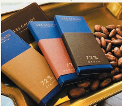
タブレットショコラ (各種 1080 円)