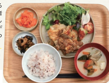
アワーズ定食 (平日週替わりランチ 1300 円)