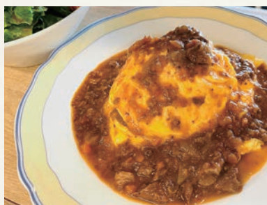
半熟卵のオムライス ビーフシチューソース (ランチ限定 1300 円)

大崎駅から徒歩 5 分、旬の食材を活かした料理をオープンキッチンから届ける一軒家ビストロ。ランチ限定のオムライスは、ふわふわ卵に濃厚なデミグラスがたまらない。人気店なので確実に入りたい場合、予約がオススメ。