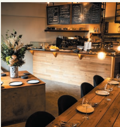
ゆったりと過ごせる店内