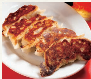
餃子 (5 個 500 円) ※夜のみ提供