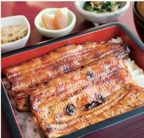
うなぎ (4400 円)

創業 100 年を越える横須賀の老舗うなぎ店が目黒に上陸。国産養殖の肉厚のうなぎを丸ごと 1 匹使った「うなぎ重」はボリューム満点。代々受け継がれてきた秘伝の甘めのタレとの相性はバツグン。