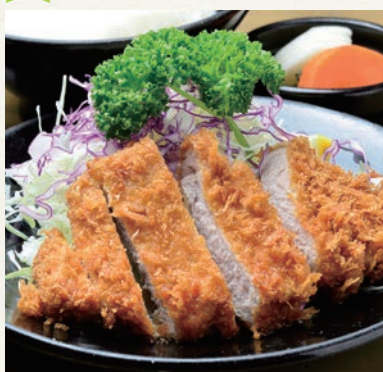
ロースかつランチ (1400 円)

目黒でとんかつを食べるならまずはココ。創業 40 年以上の人気店で、気さくな店主が一枚一枚丁寧にあげる庶民派のかつは、数々の著名人たちが魅了してきた。ごはん、キャベツ、お味噌汁が 1 回までおかわり無料!