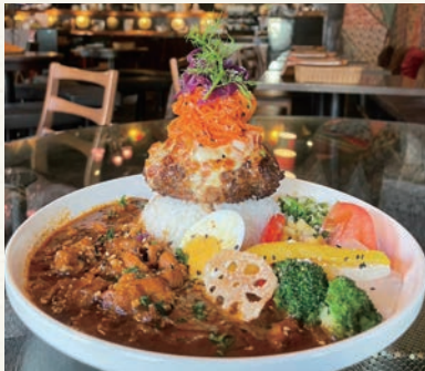
天空バーグカレー (ランチ限定 2400 円)