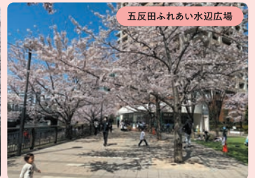
五反田ふれあい水辺広場