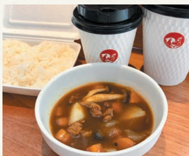
鶏だしチキンスープカレー (Rサイズ 350 円、ごはんセット + 170 円)

五反田で創業 75 年の鶏肉専門店が手がける、鶏だし専門店。お料理用の鶏だしだけでなく、スープカレーや週替りポタージュ、日替わりスープ、鶏おこわごはんのセットなど、調理したスープ・お惣菜も販売している。