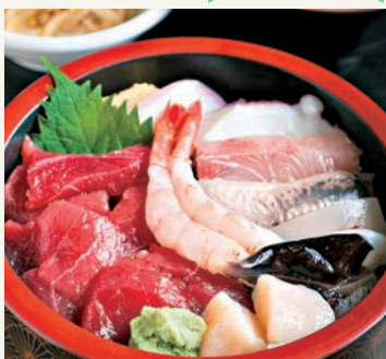
海鮮丼 (1100 円)