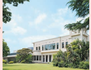
本館外観 (南面)

朝香宮邸として 1933 年に建てられたアール・デコ様式の建物。首相公邸や迎賓館としても使われてきたが、1983 年 10 月に美術館として一般公開された。